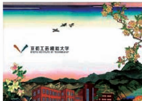
地下鉄松ヶ崎駅サインボード