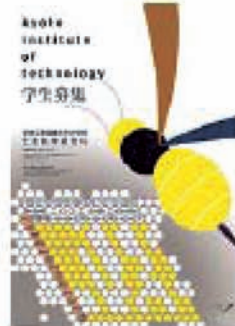
大学院入試広報ポスター