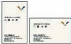
大学シンボルマーク、ロゴ、それに伴うビジネスツール