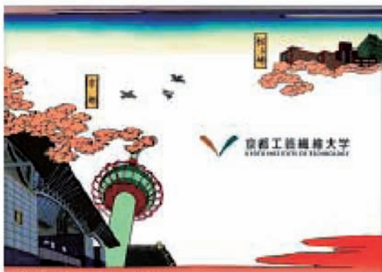
地下鉄京都駅サインボード